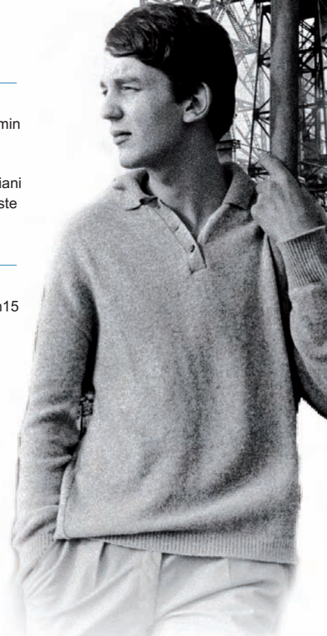
Jacques Higelin, Le Bonheur est pour demain